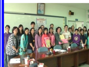
閱讀團隊校際交流