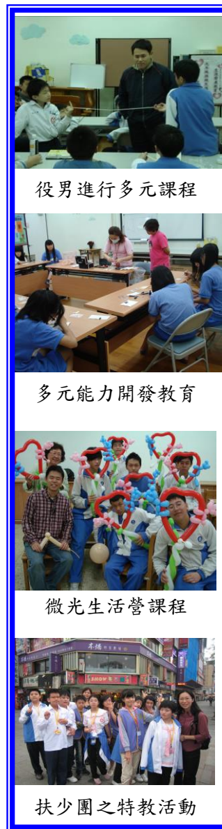
役男進行多元課程