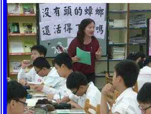
生物活化教學示範