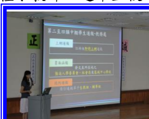
中輟上線研習講座