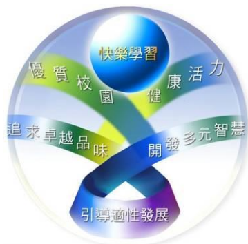
圖 2-1 萬華國中學校願景圖