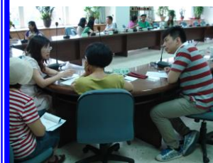
國中小資源聯繫會議