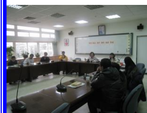
中輟生鑑復輔會議