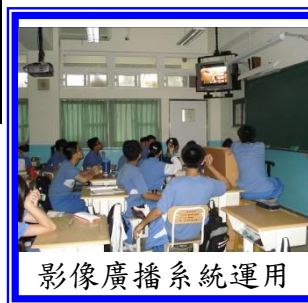
影像廣播系統運用