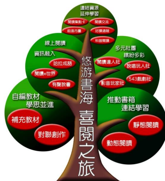
圖 3-1 萬華國中閱讀特色課程架構圖